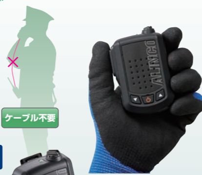
高性能ノイズキャンセラー内蔵ワイヤレス・スピーカーマイク 音声出力3W EMS-87BNC