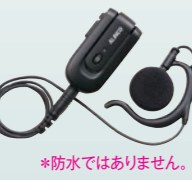
ワイヤレス・イヤホンマイク EME-80BMA