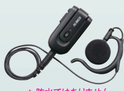
ワイヤレス・イヤホンマイク EME-80BMA