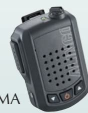
ワイヤレス・スピーカーマイク 音声出力3W EMS-87B