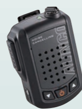
高性能ノイズキャンセラー内蔵 ワイヤレス・スピーカーマイク 音声出力3W EMS-87BNC