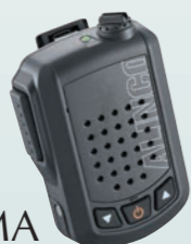
ワイヤレス・スピーカーマイク 音声出力3W EMS-87B